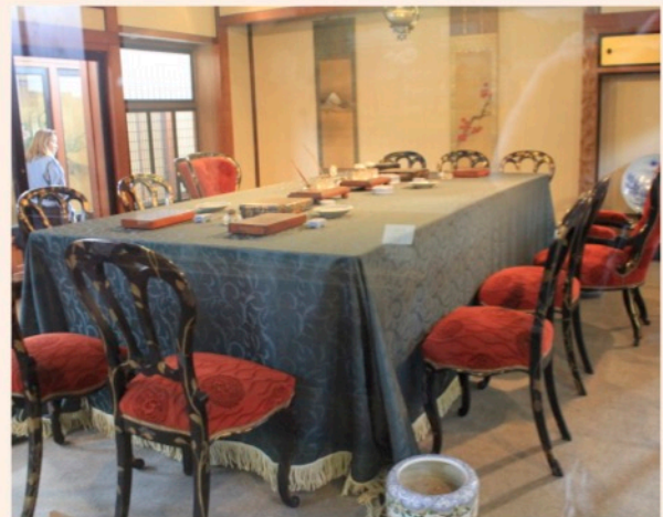
下関条約が結ばれた場所(ホンモノ)

明治になって日清戦争の講和条約を結ぶ時にも下関は登場する。地元の英雄伊藤博文と清の李鴻章が話し合いをしたのも下関だった。こうして結ばれたのが下関条約だ。日本各地、色んな歴史の舞台があるもんだねえ。(≥▽≤*)