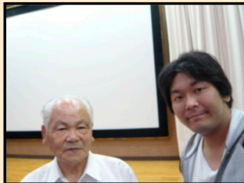
元特攻隊のおじいちゃんに話を聞く