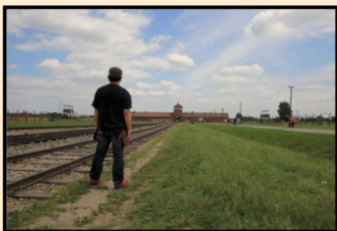
アウシュビッツ強制収容所