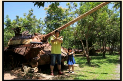
カンボジア内戦を学ぶ