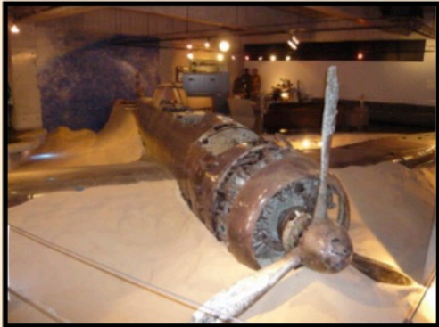
鹿児島知覧にある特攻隊基地

人類は2回も“世界大戦”っていう愚かな殺し合いをしてしまった。それを繰り返さないようにと、世界中に『負の遺産』と呼ばれるものがあるんだ。「戦争が起こるとこんなにヒドイんだよ。悲しいんだよ。」そんなメッセージが受け取れる負の遺産、ぜひ見学に行ってみよう！